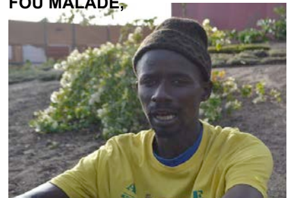
Rappeur sénégalais, auteur-compositeur et interprète

Une des figures emblématiques de la chanson sénégalaise parmi les plus connues et les plus appréciées en Europe.